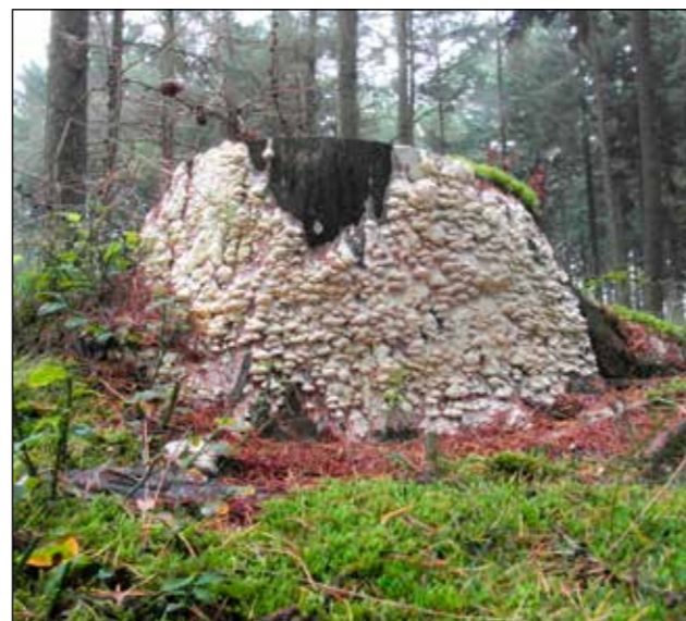
Citroenstrookzwam Meest gevonden op de stronk van gekapte dennen. In Nederland een zeldzame paddenstoel. De zwam is het meest gemeld in Noord-Brabant en Drenthe. De citroenstrookzwam vormt brede stroken die het substraat geheel overdekken. Het opvallendste kenmerk zijn de citroengele poriën, waar de soort zijn naam aan heeft te danken.

De zwam groeit op poppen van vlinders in diverse biotopen. In Nederland is de soort vrij algemeen.