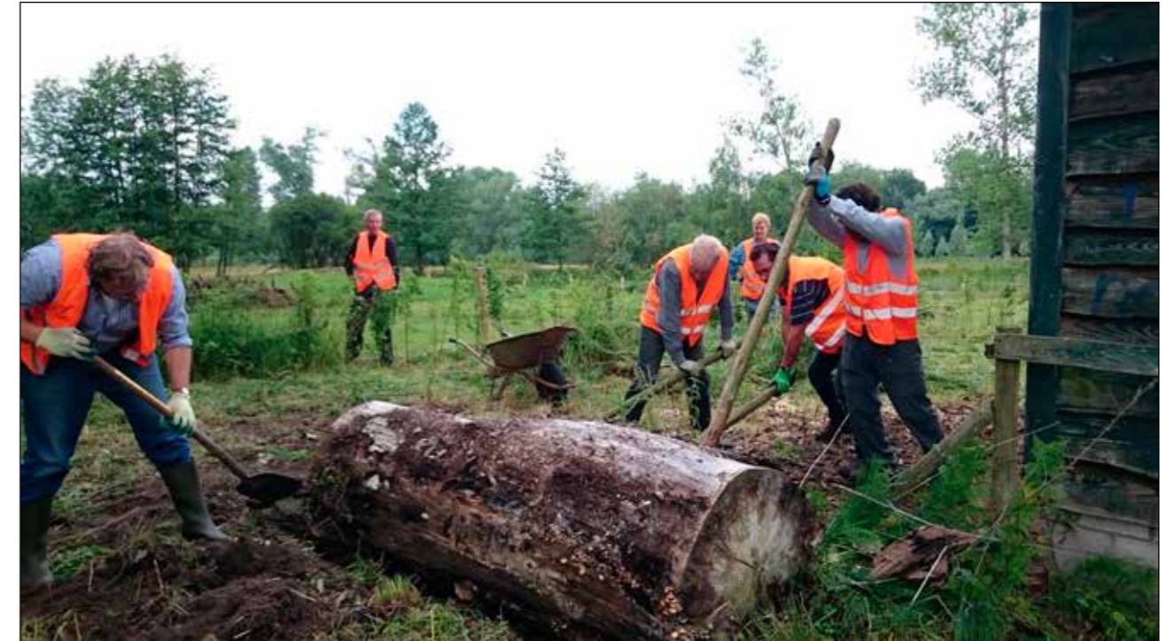
Opruimen rond het schuurtje: met vereende kracht lukt het deze dikke boom weg te rollen.

Het waren gezellige ochtenden waar zo'n 40 vrijwilligers van de WNLB en Dommelbimd actief zijn geweest.