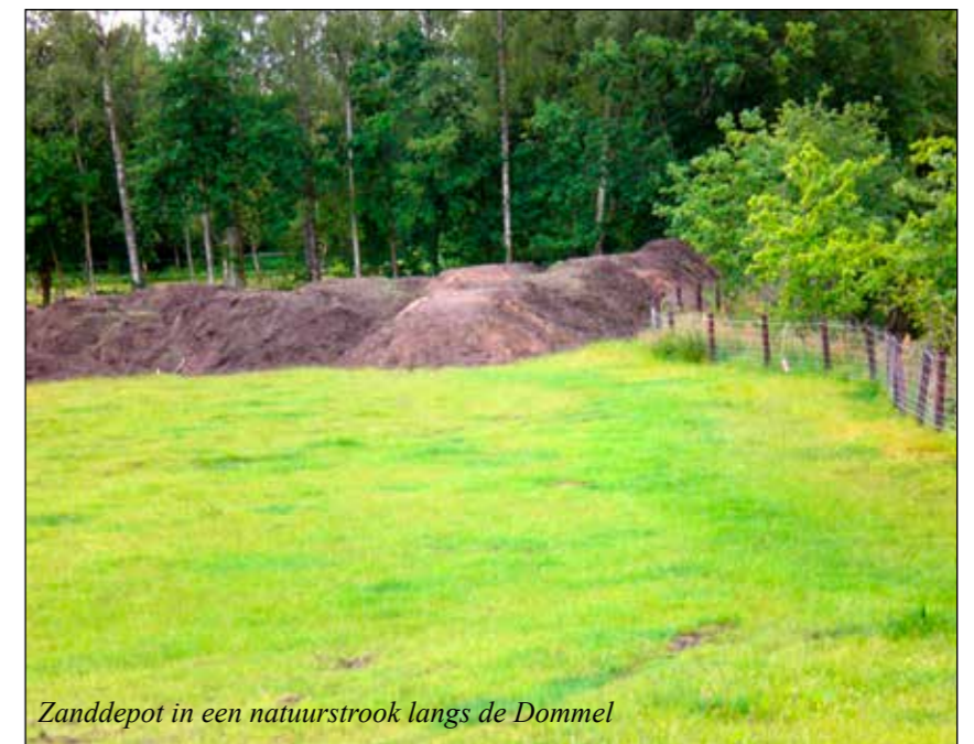
Zanddepot in een natuurstroom langs de Dommel

In dit verslagjaar zijn er geen bijzondere ontwikkelingen geweest bij het nader vormgeven/uitwerken van delen van het door het Waterschap gepresenteerde beekherstelproject Dommel door Boxtel. De WNLB heeft regelmatig contact met de uitvoerders van het project en is tot heden tevreden met de feitelijke uitvoering daarvan.