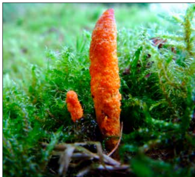
Rupsendoder ( Cordyceps militaris ) De zwam wordt 2 tot 6 centimeter hoog, en is een half tot 1 centimeter dik. De kleur van de zwam is oranjegeel tot oranje, de steel is meestal wat bleker. Op de hoed bevinden zich fijne wratjes.