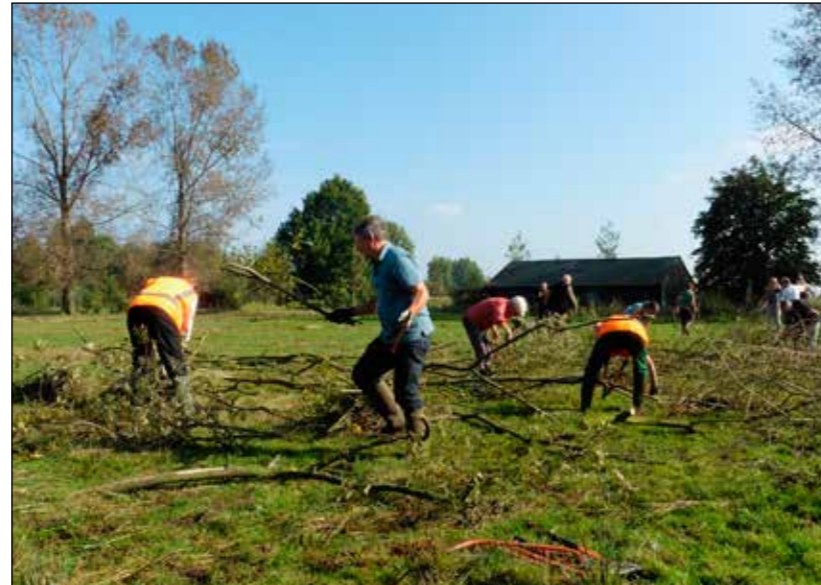
De poel wordt ontdaan van wilgenstruiken.