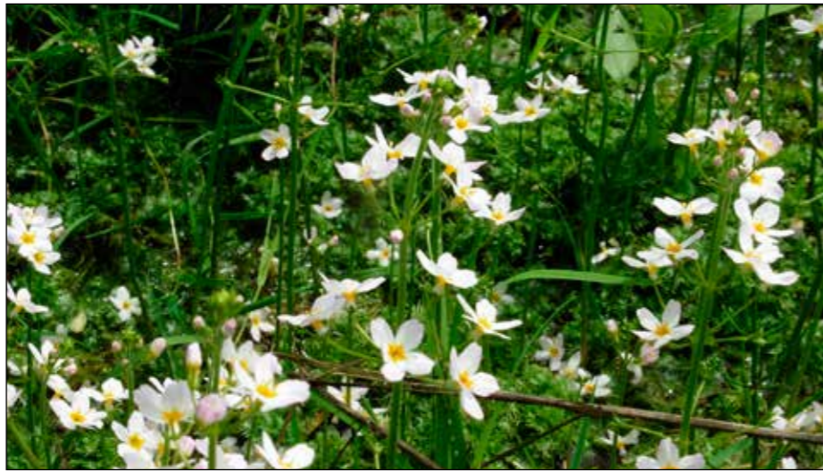
Waterviolier in één van de kwelslootjes.

Ook het verwijderen van de wilgen uit de hooilanden en de slootjes heeft al geleid tot nieuwe natuurwaarden: op de plek waar de wilgen zijn gezaagd zijn breedbladige wespenorchissen opgekomen en de waterviolier lijkt zich uit te breiden.