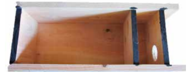
Links een voorbeeld van een kerkuilkast van binnen en hierboven een steenuilenkast.

eieren zijn uitgebroed en er jonge uiltjes zijn. De kans op verstoring van de broedsels is dan het kleinst. Niet altijd is er een succesvol broedgeval, maar soms zijn er indicaties dat de kast toch is gebruikt door een Steen- of Kerkuil. Dit is vaak te zien aan in de kast of omgeving aanwezige braakballen.