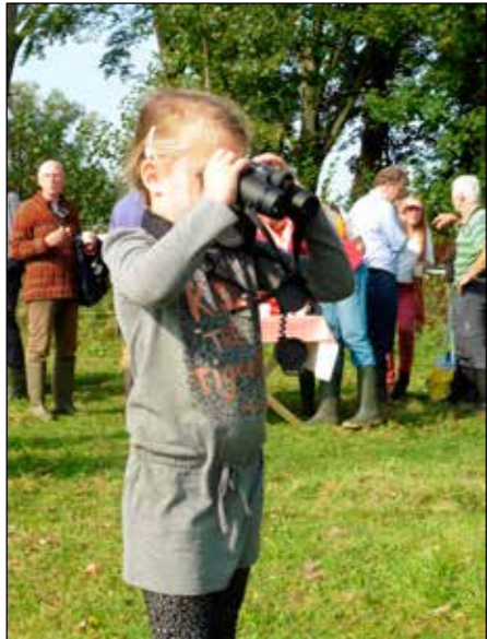
Vogels kijken tijdens de opening van het werkseizoen

Op een mooie zaterdag eind september waren er verschillende activiteiten georganiseerd: zo konden de handen uit de mouwen bij het verwijderen van wilgenstruiken uit de poel, maar ook waren er rondleidingen met de vogel- en florawerkgroep.