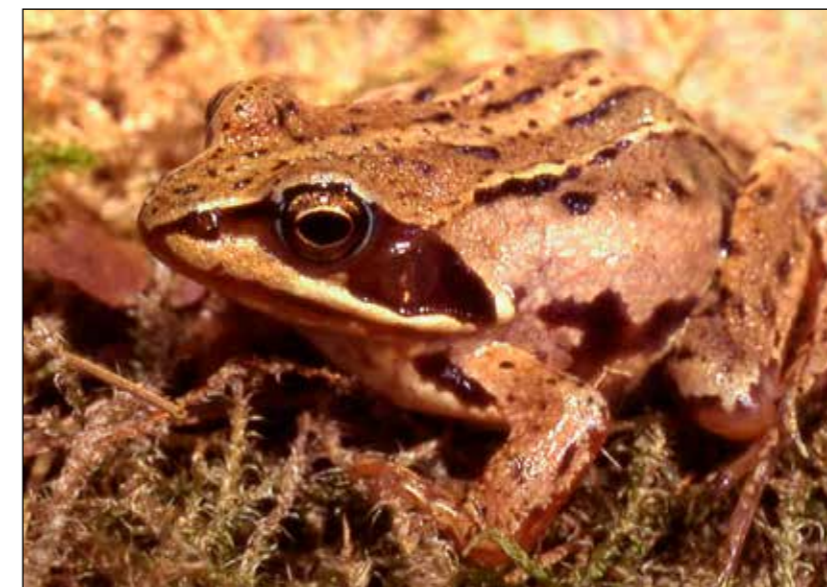
Rana arvalis, de heikikker

Met koffie met iets lekkers werd een succesvol jaar van de poelenwerkgroep afgesloten.